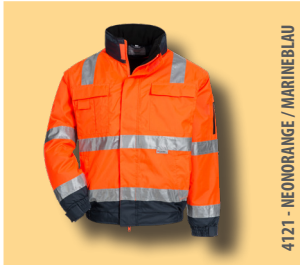
4121 - NEONORANGE / MARINEBLAU