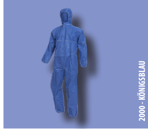
2000 - KÖNIGSBLAU