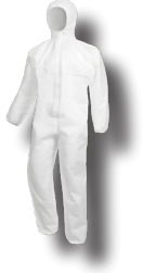
1100 - WEISS