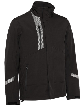
ILLUMINATED REFLECTIVE TAPE