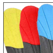
HAIX® Vario Wide Fit System