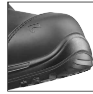
HAIX® Composite Schutzkappe