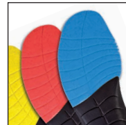
Vario Wide Fit System