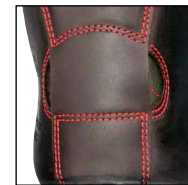
HAIX® FP System