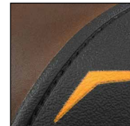
GÜK mit versenkten Nähten