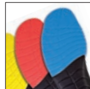
Vario Wide Fit System