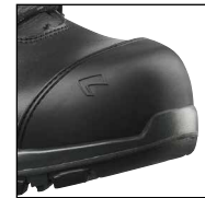
HAIX® Composite Schutzkappe