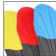
HAIX® Vario Wide Fit System