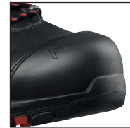
HAIX® Composite Schutzkappe