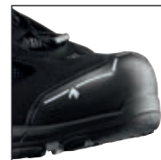
HAIX® Composite Toe Cap