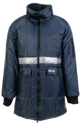
marine, Innenfutter kornblau 5131