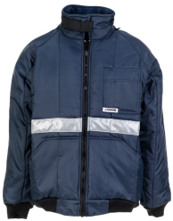
marine, Innenfutter rot 5120