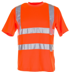
uni orange 2095