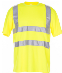
uni gelb 2096