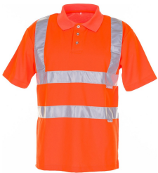
uni orange 2091