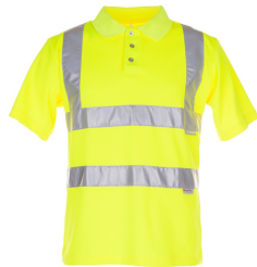
uni gelb 2092