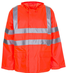
uni orange 2061