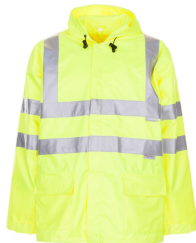
uni gelb 2062