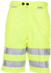
uni gelb 2014