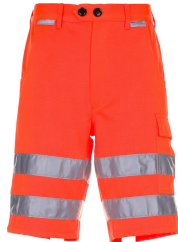
uni orange 2015