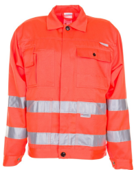
uni orange 2001