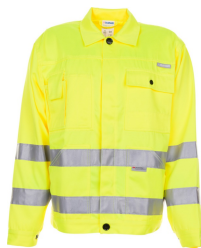
uni gelb 2002