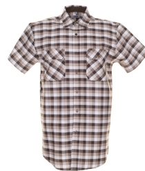
stone kariert 0488