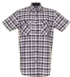
schwarz kariert 0486