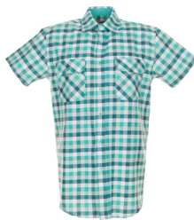
grün kariert 0487