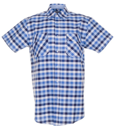
blau kariert 0485