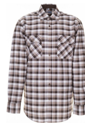
stone kariert 0483