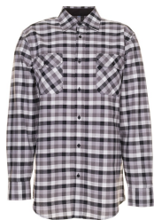
schwarz kariert 0481