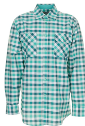
grün kariert 0482