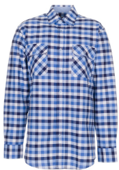
blau kariert 0480