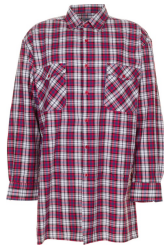
rot kariert 0451