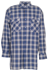
blau kariert 0450