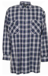
grün kariert 0452